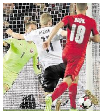
Timo Werner erzielt das 1:0 für Deutschland.