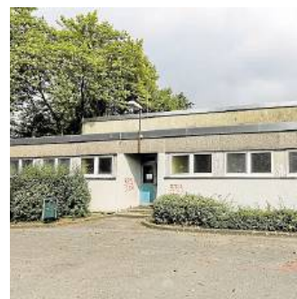
Eine der gesperrten Turnhallen.

DORTMUND. An der Spitze der Gemeinnützigen Genossenschaft (GWG) Hombruch-Barop gibt es Hauen und Stechen. Der Machtkampf zwischen Teilen des Vorstands gegen Teile des Aufsichtsrates gipfelte jetzt in einer Klage der ehrenamtlichen Vorstandsmitglieder gegen ihre eigene Genossenschaft. → 1. Lokalseite